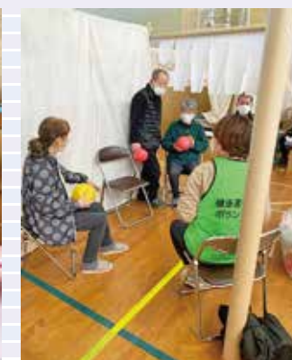
ボランティアによるリハビリ