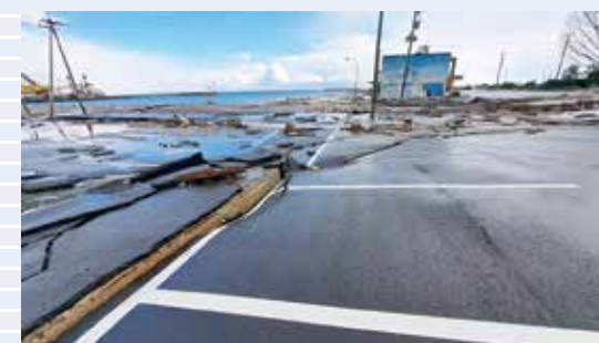
沿岸部の津波による被害