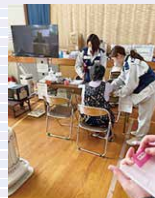
保健師による巡回