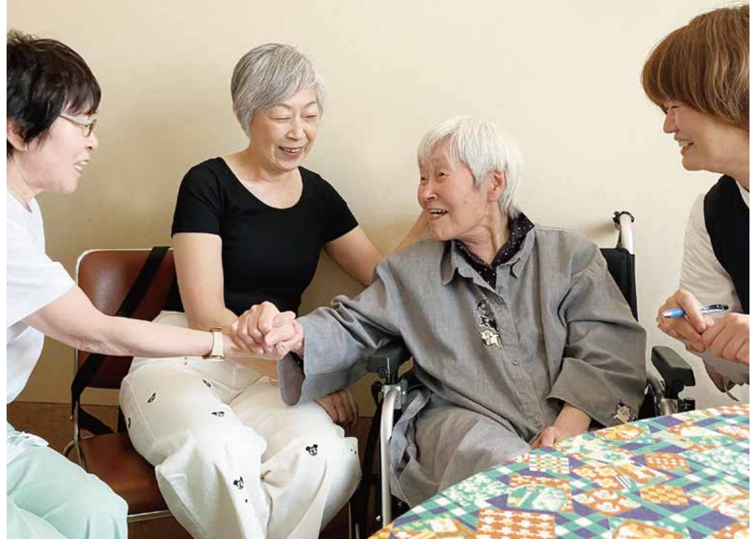
川添清流苑 脳トレセンター