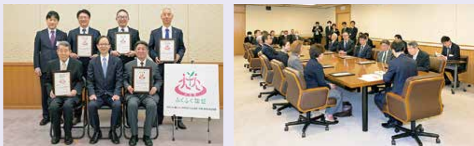
「おおいた 働きやすくやりがいのある福祉・介護の職場 認証制度(障がい福祉分野)」の認証式

令和4年度から介護分野で開始された同認証制度、令和6年度後期から障がい部門でも開始となり、清流共生会も認証をいただくことができました。介護分野、障がい分野共にふくふく認証の認証を頂き、これからはより働きやすくやりがいのある職場づくりに邁進して参ります。