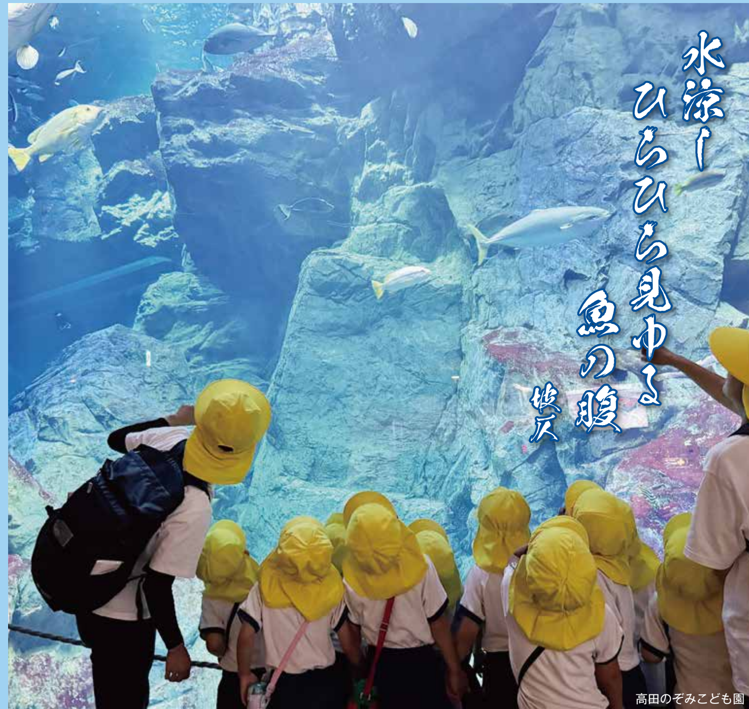
高田のぞみこども園

スウェーデンの古くからある「オムソーリ」という言葉は、直訳では、「心配、心くばり、尽力」という意味を持ち、清流共生会は、「オムソーリ(心くばり)」を苑としてしています。